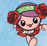
ぼらのまち福山 イメージキャラクター 「ローラ」